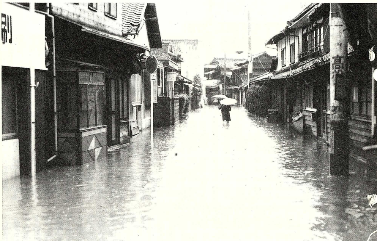
(集中豪雨により床上、床下浸水のあった本町通り)