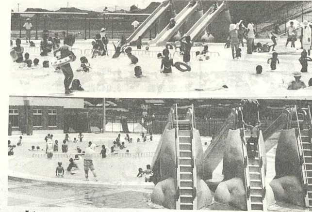
【親子づれでにぎわうオープン当日・7月20日】

赤池町総合運動公園の一環として、昭和五十四年度開業事業で当町ボタ山下に建設されていた町民プールがこのほど完成し、七月二十日よりオープンしました。 このプールは、敷地面積約八、〇〇〇平方メートル、事業費一億四、三〇〇万円をかけて五〇米プール（ハコリス二、〇〇〇平方メートル）と幼児子供用プール（五〇四平方メートル）が設置されたものです。又、町過疎事業で約七、〇〇〇万円をかけて管理棟（四二〇平方メートル）も建設されており、この管理棟の外壁にはすべて「町上野焼大型共同作業場」で