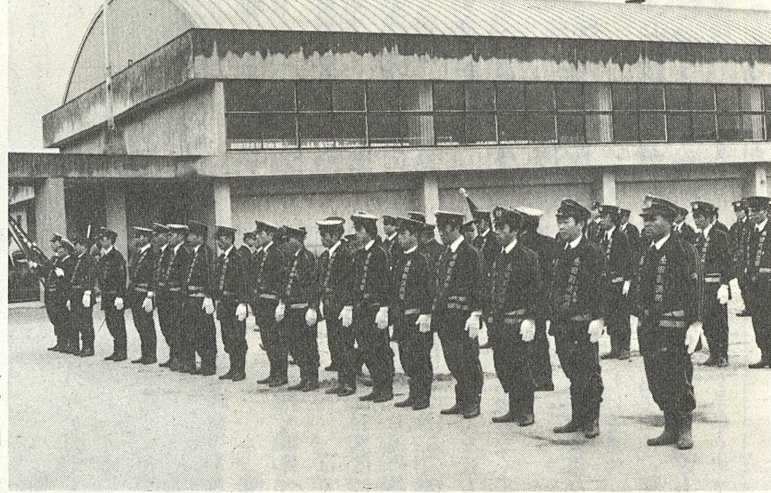
【堂々の規律ある整列風景より・糸田小学校グラウンド】