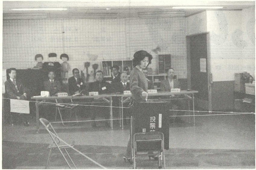
(清き一票を投じる有権者たち)

四月十五日に告示された赤池町議会議員一般選挙は、町議会議員十九人(定数十八人)が立候補を行ない、二十二日投票が行われ、投票率は九十三・七九割という高いものでした。