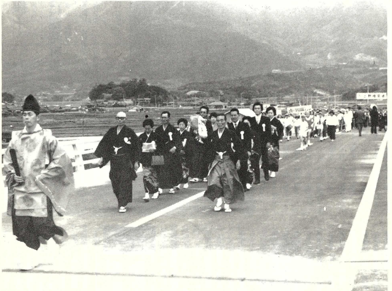
(渡りぞめで開通を祝う住民たち・4月13日)