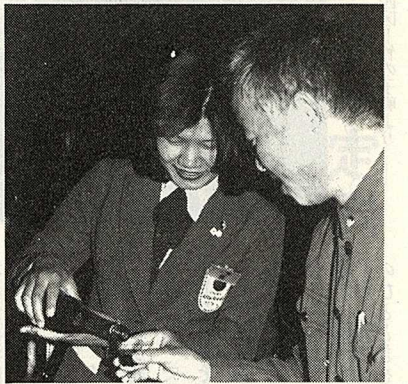
県青年の船訪中記

熱烈歓迎！ 中国訪問中、熱烈歓迎革命委員会主催のレセプションで、革命委員に敬意を表する筆者