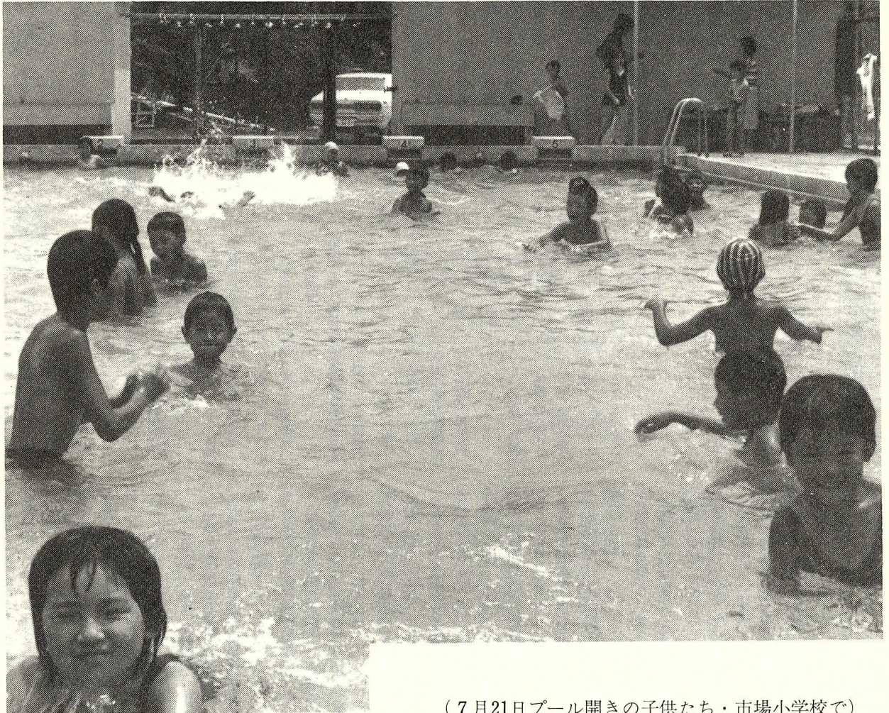
(7月21日プール開きの子供たち・市場小学校で)