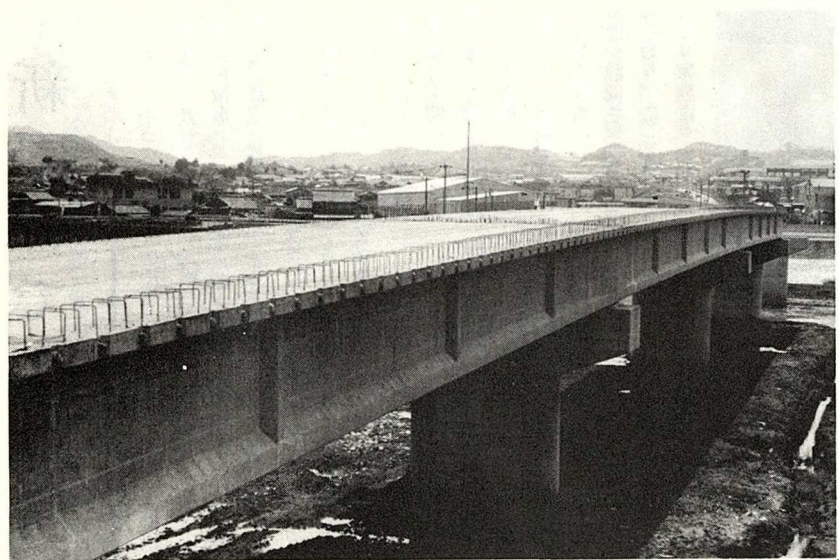
上野橋架設（第3次）工事進捗状況写真 来年4月に完成予定