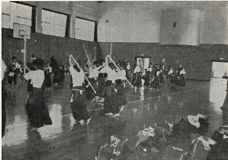
少年剣道親善試合に熱戦する豆剣士たち 町民会館にて

六月十五日午前十時から町民会館体育館において川崎、方城、直方、赤池の五団体参加により、各団体中学生一チーム、小学生二チーム編成をもって一チーム二戦方式の近隣市町村対抗剣道親善試合を行ないました。選手応援をふくめ約二百人が折からのカラ梅雨の暑さにも負けず、白熱した好試合を展開し、応援もこれに対しおしなない拍手を送りました。