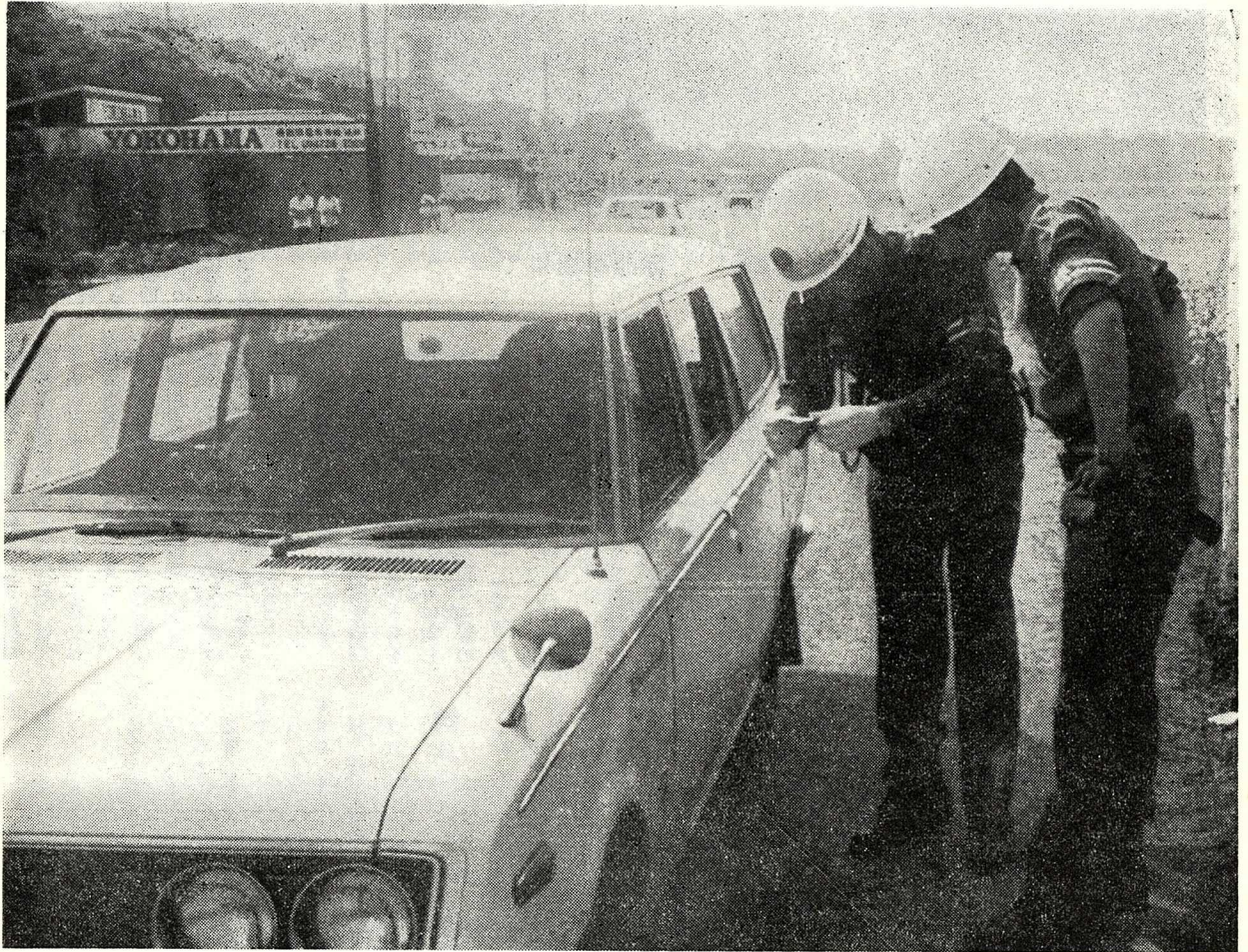
車を検問する機動隊員 (赤池にて)