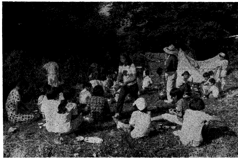
(添田町大藪キャンプ場において)

子供会のリーダー育成を目的として毎年開催して来たリーダーキャンプは陣屋ダムのつち音のする添田町と朝倉郡との境に大藪という所で本年は開催されました。参加者三十五名が各地区より集