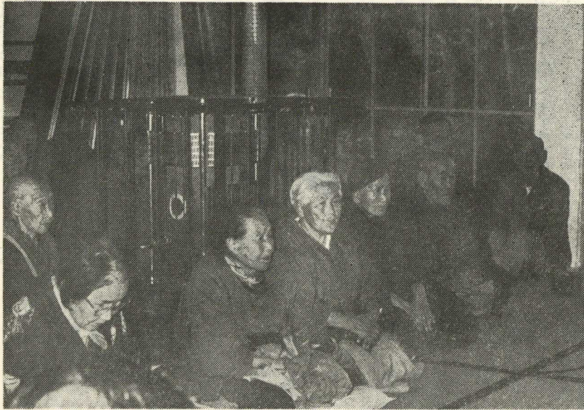
赤池町社会福祉見舞金を受けるお年寄達 (老人ホーム天郷荘)