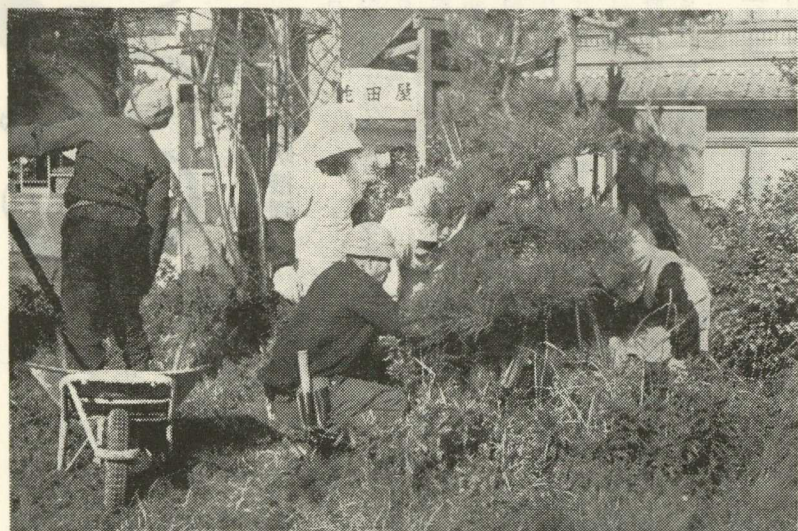
駅前公園を清掃する四季会員の皆さん