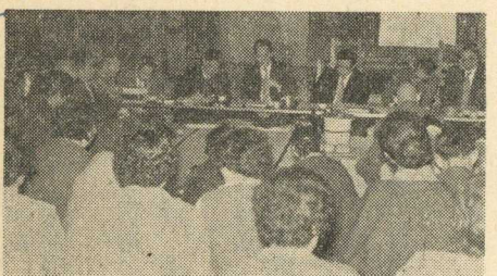
(写真は盛況の移動役場)

町では漏水している溜池はこれまで調査して補修している。なお漏水しているなら再度調査することにした。(交通通信) 国鉄バス運行削