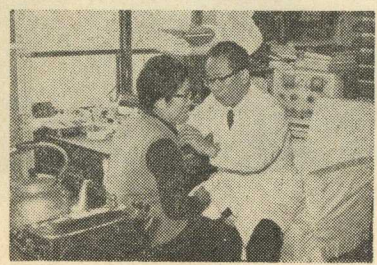
老人の生活にとって不安になるのは病気である。医療費の無料化によって、健康診断を受けやすい余生をおくって頂きたい。 写真は安心して診療を受けるお年寄り