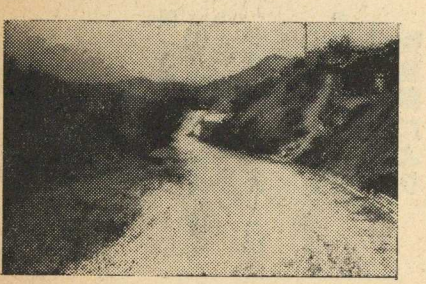
写真はバイパス工事現場

●着々すすむ 小竹―赤池線 「バイパス道」 昭和四十四年から小竹―赤池線のバイパス道が昭和四十六年度を完成目標に工事が順調にすすんでいます。赤池町の道路事情も日増しに混雑しバス会社から町や、車の所有車に運行上の協力を呼びか