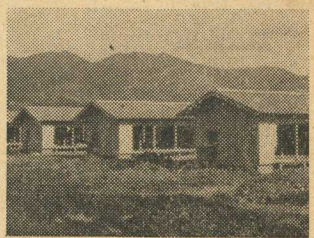
完成近い町営住宅

▼役場庁舎の化粧直し 町の表玄関である役場庁舎の「化粧直し」工事が十一月から始められ