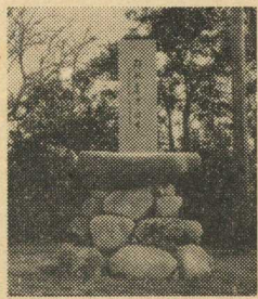
上野小学校の記念碑

上野小学校は校舎完成を記念して「伝統のある学校で可愛い子どもたちが学習に励んでいる」市場小学校には文部大臣表彰を記念して身長が伸び、体位が伸び力が伸び学校が伸びて行くことを意味した。伸びよ、の題字がそれぞれきざみこまれています。