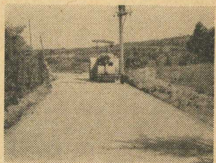
完成した青年の家附近道路

この道路は(炭坑職者緊急就労対策事業)によって工事を着工しましたが昨年七月完成しました。この道路は青年の家へ通じる道路で他町村からの年間の利用者は日増しに多くなり、悪路として研修生も通行人を悩ましていましたが舗装道路完成で大変便利になりました。