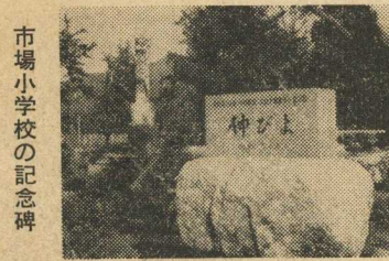
市場小学校の記念碑

赤池町敬老会が九月十五日赤池中学体育館で行なわれ、七十五才以上の老人一八六人が集って長寿を祝い