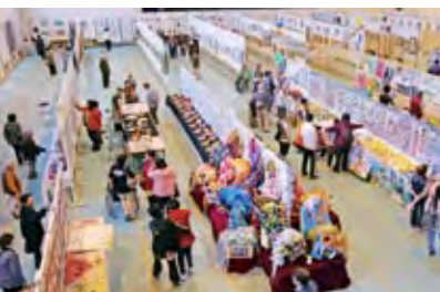
絵画や書、生け花、手芸、伝統的工芸品の山野焼などがズラリと並んだ展示会場には、2日間で延べ3千人が来場。子どもから大人まで、作品の魅力に身も心も引き込まれていました。

を受けました。中央公民館で行われた「囲碁大会」は盤上で静かな熱戦を展開。そして、最終日となった25日の「ふれあいコンサート」では、出演者たちのハイモニーが地域交流センターを癒やしの美声で包み込みました。 5週に渡って繰り広げられた福智町文化祭は、芸術の秋と見事に融合。来場者の心を大きな感動で包み込みました。