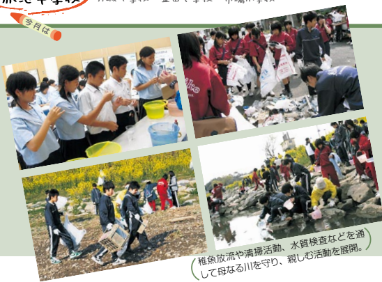
（稚魚放流や清掃活動、水質検査などを通して母なる川を守り、親しむ活動を展開。）