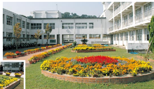
生徒と教職員が育てた中庭の花壇、4月11日には95人が入学。

赤池中学校は、東にそびえる雄大な福智山系と豊かな流れをたたえる彦山川に親しみながら、郷土を愛し、地域と共に歩む校風を大切にしています。校庭は四季を通して季節の花が咲き誇る「花いっぱい学校」です。