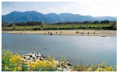
↑ひこさんがわ夢の会との河川敷清掃活動