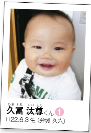
ひさとみ たいそん 久富 汰尊くん 1 H22.6.3生 (弁城 久六)