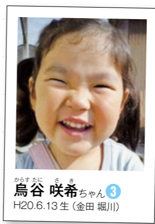
からすたに さき 烏谷 咲希ちゃん 3 H20.6.13生 (金田 堀川)