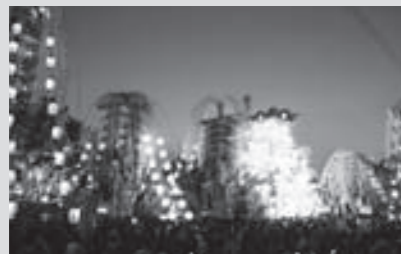
固 糸田役場地域振興課 ☎ 26-4025

【糸田町】糸田祇園山笠 5月14日 日 18:00 ~ 15日 日 17:00 ~ 最大で高さ9m、重さ2トンにもおよぶ山笠が威勢のいい掛け声とともに町内を練り歩きます。糸田が感動と興奮に包まれる2日間です。 一フエスライバルパーク(役場跡地)に、大迫力の山笠が大集合します。