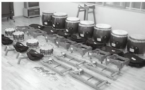
購入した長胴太鼓7個などは児童センターに保管。

平成19年度一般コミュニティ助成事業で、長胴太鼓、締太鼓、チャッパ、チャンチキなどを購入しました。これは、みなさんが購入した宝くじを財源に、財・自治総合センターの普及広報事業の一環として助成されたものです。