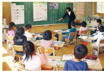
↑木のぬくもりと自然の光に包まれた教室。

1 充実した学習環境 毎朝授業が始まる前の15分間を朝の活動として、曜日ごとに計算や漢字など内容を決めて学習に取り組んでいます。校長先生をはじめ担任以外の先生も総出で2〜3人体制で行うので、短い時間でもより多くの児童の質問に答えることができます。ほかにも音読タイムや読み聞かせの活動などを仕組んで子どもたちの学力向上を目指しています。 現在、上野小では1クラスが20人前後ですが「指導方法工夫改善教員」を中心とし、さらにクラスを2分割して授業を行う時があります。個々の課題などを行い、興味・関心別の分割などを行い、子どもたち一人一人のニーズに対応できるようにしています。