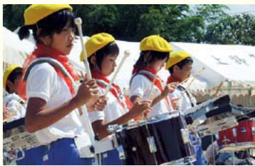
↑ベレー帽とスカーフを身にまとい、心をついて演奏しました。

●遠足(保育園児との交流) 今年度は、「福智町幼児体験活動研究開発事業」を受け、5年生が保育園児と交流を行いました。内容は、交流会や福智山登山です。登山では保育園児の手を引き、共に汗をかきながら一生懸命に登