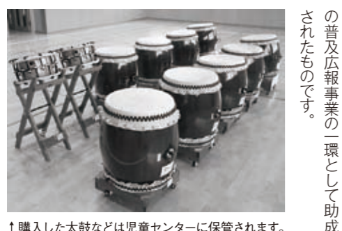
↑購入した太鼓などは児童センターに保管されます。

宝くじ助成で和太鼓購入 平成22年度一般コミュニティ助成事業で、締太鼓、長胴太鼓、立ち台、平置台を購入しました。これは、みなさんが購入した宝くじを財源に、(財)自治総合センターの普及広報事業の一環として助成されたものです。 飯塚駐屯地記念行事 日時 10月17日(日)9時～15時 場所 飯塚駐屯地(飯塚市津島) ☎0948-2277651 障害者職業訓練生募集 簿記の基礎など、一般事務に必要な知識と技能を習得します。 訓練場所 福岡ソフトウェアセンター(飯塚市幸袋) 期間 12～2月の平日10時～17時 料金 約1万1千円(教材費) 申込締切 10月28日(金)定員15人 福岡県障害者職業能力開発校 ☎093-741-5431