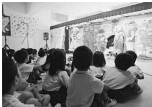
↑園児に大人気の人形劇や英語、体操教室などのカリキュラムを取り入れ、園児の知力と体力の向上を図るひろばる幼稚園。