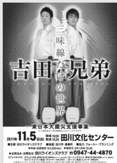
田川ライオンズクラブ ☎ 44-4870

テレビなどで活躍する津軽三味線奏者の吉田兄弟。伝統と格感を備えたアーティストの演奏を、ぜひ身近で堪能してください。