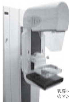
乳房レントゲン検査のマンモグラフィ

無料クーポン券で検診を受診できる期間は、今年の12月末(医療機関の診療日)までです。医療機関に検診の定員がありますので、早めの予約をおすすめします。 ※がん検診を受診できる医療機関の名簿は、5月にクーポン券と一緒に送っていますのでそちらを確認してください。