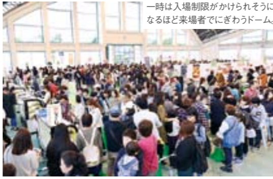
一時は入場制限がかけられそうになるほど来場者でにぎわうドーム。