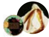
[ スイーツ ]

福智ブランドの特産品「ふくち☆リッチジェラート」。福智産素材などをぜいたくに使った濃厚な口どけが特徴。