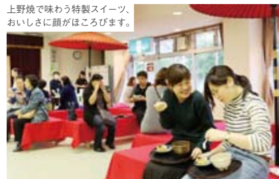
上野焼で味わう特製スイーツ、おいしさに顔がほころびます。