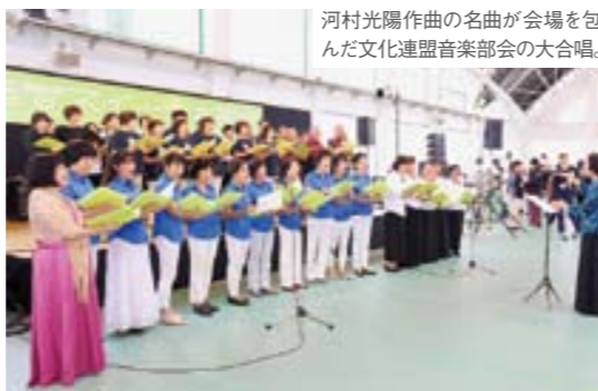
河村光陽作曲の名曲が会場を包んだ文化連盟音楽部会の大合唱。