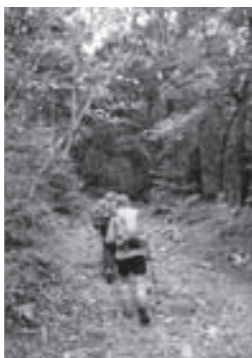
↑健康増進と町村間の親睦や交流を図ることが目的です。

北九州国定公園の中心地で、国内有数のカルスト台地として名高い平尾台の「貫山(ア12)」に登山します。広大な草原に白い石灰岩が並ぶ羊群原や鍾乳洞が独特の景観を保つ平尾台で、爽やかな汗を流しませんか。 日時 5月8日(日) 9時~ 集合 平尾台入口吹上峠駐車場 申込締切 4月21日(日)