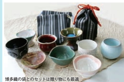
博多織の袋とのセットは贈り物にも最適

国指定の伝統的工芸品「上野焼」から、バレンタインチョコにかけた「ちよこ」が、この時期限定で販売されています。上野焼協同組合の16窯元が焼き上げた色も形も多種多様の「ちよこ」は、年代を問わず毎年大好評。きつとあなただけのお気に入りが見つかるはず。お問い合わせは、2月14日(日)までに上野焼陶芸館(毎週固定休)で！ また、アクロス福岡でも「バレンタイン猪口展」が2月10日(金)～13日(日)に開催されます。ぜひお立ち寄りください。 問 上野焼協同組合 ☎ 28-5864