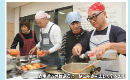
食生活改善推進員と一緒に基礎を楽しく学べます

男性を対象に、基本的な料理や知識を学べる「料理教室」が開催されます。次の3会場から、参加希望会場を電話でお伝えください(重複不可)。参加無料 コスモス保健センター会場 1 2月17日(金) 24日(日) 3月3日(日) 金田保健センター会場 1 2月16日(金) 21日(日) 28日(日) 方城保健センター会場 1 2月18日(金) 23日(日) 3月2日(日) 持参する物 ▶ エプロン、三角巾、米1合 時間 ▶ 9時30分～12時 問 役場福祉課福祉係 ☎ 22-7763