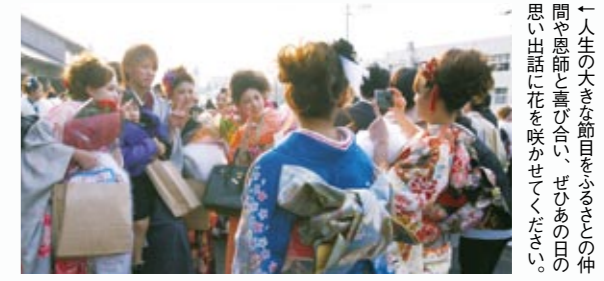
←人生の大きな節目をふるさとで迎える。間や思節と喜びを分かち合い、ぜひあの日思い出話に花を咲かせてください。

新 成人への祝福と期待を込めた成人式が、下記の日程で開催されます(対象者には案内状を送付)。