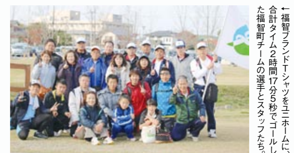
←福智ブランドTシャツをユニホームに合計タイム2時間17分5秒でゴールした福智町チームの選手とスタッフたち。

第 1回市町村対抗「福岡駅伝」が11月16日に筑後市で開かれ、全9区間30・1kmを舞台に計58チーム総勢約520人が健脚を競い合いました。この駅伝は、「郷土愛の醸成と世代間交流を深める」ことを目的に今年初めて開かれ、県内の60市町村が参加。福智町は惜しくも入賞を逃したものの、一本のたすきをつなぎながら、出身も年齢も異なる仲間と同じゴールを目指して走りぬぎ、心と心もつないだ一日となりました。