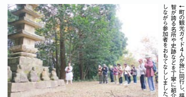
←町の観光ガイド4人が旅に同行し、福智が誇る名所や史跡などを丁寧に紹介しながら参加者をおもてなしました。

福 智山や英彦山などの雄大な自然、石炭遺産・神幸祭といった特色ある歴史や文化など、8市町村の魅力が味わえる「Tagawa Long Trail あつたがわの旅」。11月16日に行われた福智町コースには、福岡市や北九州市などから13人が参加しました。福智山麓トレッキングで紅葉と歴史を堪能した後、興国寺で座禅体験や精進料理を堪能。旅の終わりにふじ湯の里で疲れを癒やし、旅人たちは秋の福智を一日中味わいました。