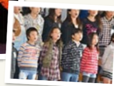
↑ 昨年の学習発表会では、学年ごとに、歌や音読などを発表。日々の成果を保護者に披露しました。