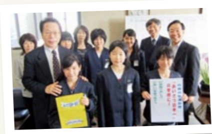
↑ 「感謝の気持ち、心こもったあいさつ」などの4つの宣言文を読み上げ、日本一あいさつができる町になるように全力を尽くすことを誓いました。

伊方小では、「豊かな人間性とたくましく実践力のある児童の育成」を目指し、児童と職員が一丸となって日々教育活動に取り組んでいます。特に、本年度は「あいさつ日本一の学校」をテーマに、5月から児童会の計画委員会を中心に、朝のあいさつ運動などの取組を始めました。また、保護者に対しても、5月のPTA総会、理事会などで、「あいさつ日本一」にむけた取組の協力や支援を要請するなど、学校や地域、保護者が一体となった取組となるよう活動を進めています。また、6月14日には、本校児童代表の子ども達が教育委員会及び町長室を訪問。「あいさつ日本一」に向けた取組の宣言をしました。