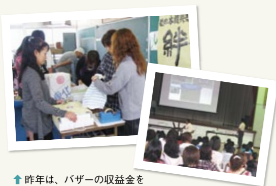
↑ 昨年は、バザーの収益金を募金として東北に送りました。