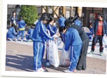
↑ やりがいを感じ、爽やかな汗を流しながら、お世話になっている地域や公共施設などを清掃する生徒たち。

方城中では、例年10月の下旬に総合的な学習時間を活用し、区内のクリーン活動を実施しています。通学路や住宅の周辺を学級単位で清掃。燃えるゴミと燃えないゴミに分別し、軽トラ約一台分のゴミを収集しています。活動後の生徒たちの感想は、「ゴミが多かったのにはびっくりした」「町がきれいになって嬉しい」などの意見が出され、毎年積極的に清掃活動を行っています。本年度も、左記の日程でクリーン活動を計画しています。地域のみなさん、中学生と一緒にクリーン活動に参加をしませんか。お待ちしております。