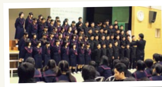
↑ 最近では校歌も大きな声で歌っており、全校合唱でも素晴らしい歌声が期待されます。