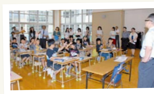
↑ 公開授業で行う国語と算数とおして、将来に生きて働く確かな学力を育てていく過程を、日本中の先生がたに見ていただきます。

市場小では児童たちに「考える力」を身につけさせるために、国語や算数で論理的に考え、豊かに表現する授業研究を重ねてきました。今年も、6月11日・21日に筑波大学付属小の先生を招いて、国語と算数の授業研究と講演会を実施。全国トップレベルの指導力を身につけようと、筑豊地区からたくさんの先生が参加しました。その成果を「基幹学力研究会全国大会」で、授業公開を中心に実施します。