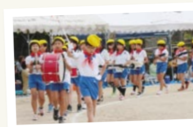
↑ 上野小の伝統である鼓笛ドリル演奏。整然と並び、統率がとれた動きで観客を魅了します。

様々なあいさつが、校内外でも「元気・笑顔・自然」にできる児童の育成に努めています。