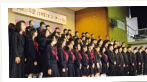
↑ 自分たちの合唱を録音し、意見を出し合ったり、少しでも納得できないところは、納得するまで修正し続ける。だわりの歌は、観客の心に迫ります。

毎年恒例となっている金田中合唱コンクールは、体育会と並ぶ2大行事の1つで、全校一丸となって取り組んでいます。特に3年生には最後の学校行事ということもあり、生徒会が中心となって全校合唱やブロック合唱の練習を企画。指導を行いながら、学校全体を盛り上げていきます。また、学級の合唱練習では、各学級で放課後や早朝、休日に練習を行いながら、全員で納得いくものを創りあげます。ぜひ心を揺さぶるハーモニーに、ご期待ください。