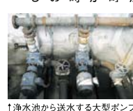
1 浄水池から送水する大型ポンプ

町内に水源を持ち、町内の浄水場で水の浄化処理が行われているのが、赤池・市場地区と伊方・弁城地区です。ここでは5か所の浄水場が稼働し、水をキレイにしています。上河原浄水場が彦山川の伏流水(地下水)、上桜浄水場が費船の井戸水、伊方浄水場が白髪川の表流水、奥池浄水場は奥池、上弁城浄水場は付近の清流をそれぞれ水源としています。