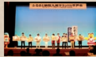
ふるさと納税九州サミットに県代表として参画。先進自治体会議にも参加し、次の展開へ動き出しています。

地域のブランド力が地方創生のカギとなるいま、求められる「なにもない」から「ここにしかない」という「逆転の視点」。そうして地域を見つめ直すことで、まちの魅力と出会い、ふるさとへの誇りへつなげていきます。このまちで生きる誇りを次代へつなぐ。そんな身近だけれど、とても大切な心の拠り所を「ふるさと納税」が私たちに気付かせてくれました。