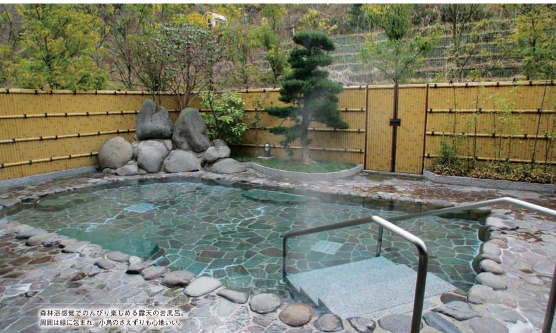
森林浴感覚でのんびり楽しめる露天の岩風呂。周囲は緑に包まれ、小鳥のさえずりも心地いい。