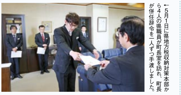
← 5月1日に県地方税収納対策本部から4人の県職員が町長室を訪れ、町長が併任辞令を一人ずつ手渡ししました。

県 と市町村が連帯して徴収対策を強化することを目的に、福岡県地方税収納対策本部から4人の職員が、5月1日に福智町へ派遣されました。任期は5月から2月末までの10か月間で、その間、町の税務課職員と共に滞納整理促進に携わります。町では、この機会に、県が持つ優れた徴収ノウハウを吸収し、従来の滞納対策の取り組みに加えて、個人住民税などの地方税のさらなる徴収率向上を図ります。