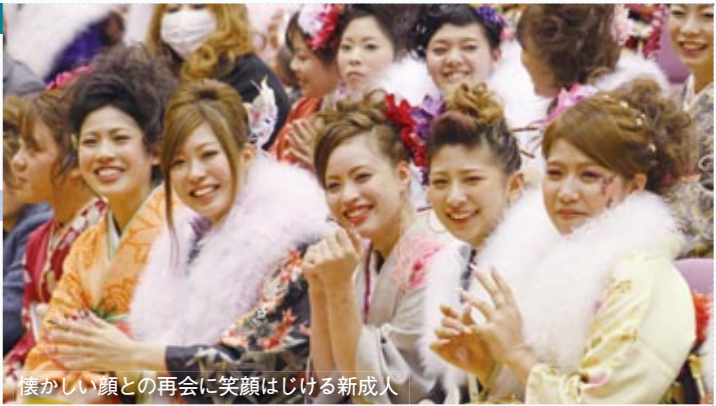
懐かしい顔との再会に笑顔はじける新成人