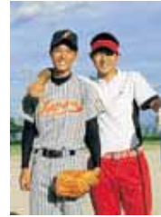
P22 - 23