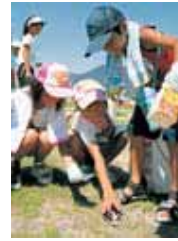
P3 - 11