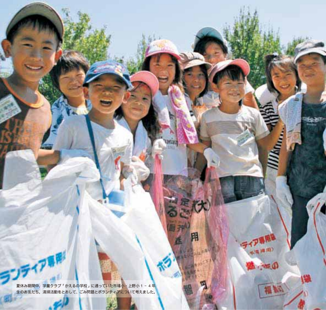
夏休み期間中、学童クラブ「かえるの学校」に通っていた市場小・上野小1 - 4年生のお友だち。清掃活動とおして、ごみ問題とボランティアについて考えました。