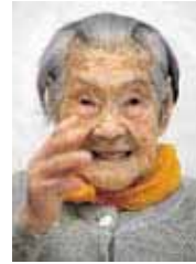
P37 - 39