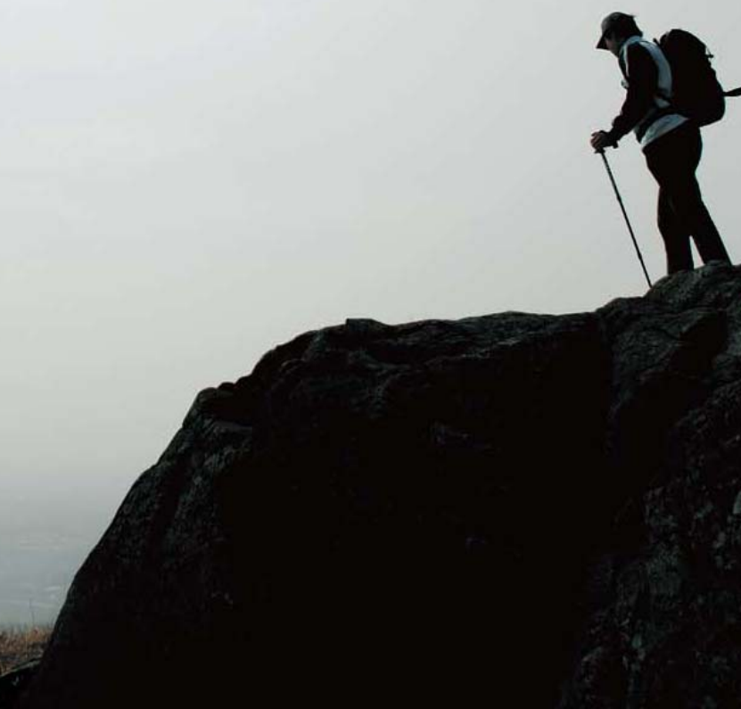
福智山山頂、眼下には新しい町が広がる。