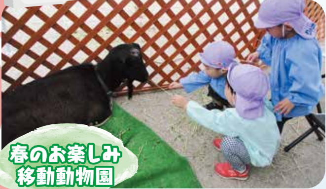
春のお楽しみ 移動動物園