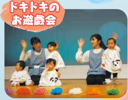
ドキドキの お遊戯会

楽しいこと いっぱい! 食べることは 生きること! 子どもたちのパワー 大人も元気をもらっています!