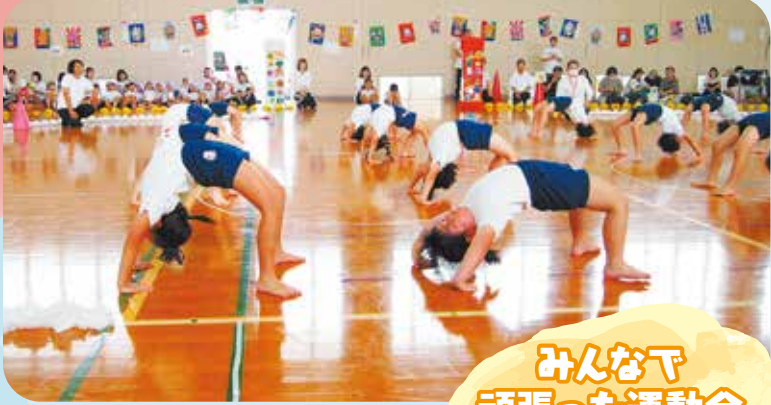
みんなが 頑張った運動会