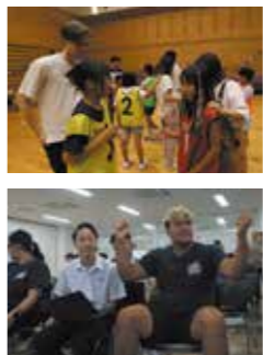
▲小中高のグローバル教育