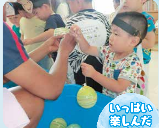
いっぱい 楽しんだ 夏祭り