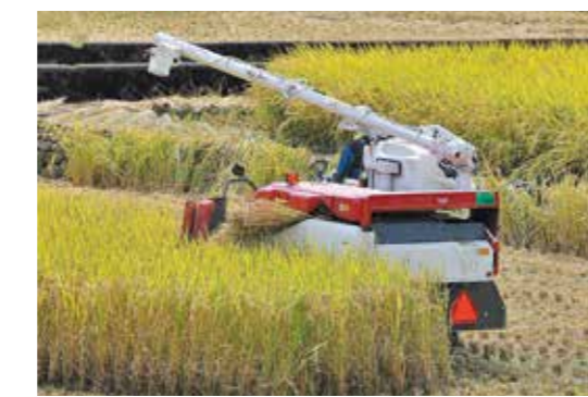
た農家への対応を伺う。

農地の8割以上を担い手が確保できれば、県の農地中間管理機構に利用権設定を進めて、農地の区間整備を進めたい。