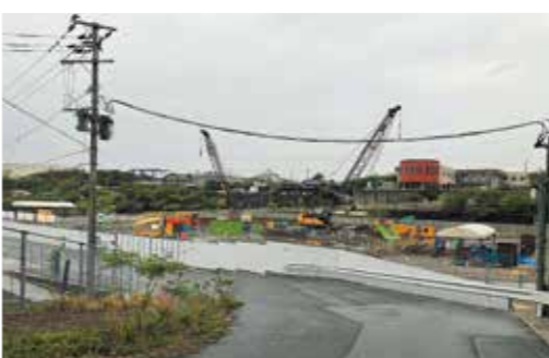
▲アリーナを建設中

問 金田小学校の今後の利活用について、中津原小学校の跡地は現在、賃貸でいろんな会社が入り有効活用されており、金田小学校も有効活