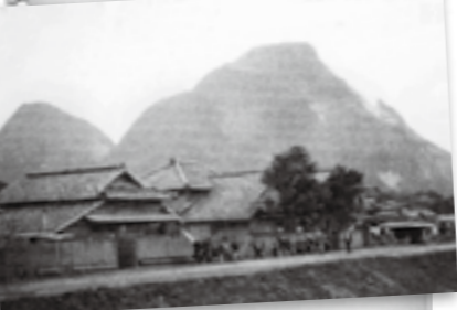
古門から望む香春岳 撮影日●昭和35年頃 撮影場所●伊方古門地区

標高500m、雄大にそびえる香春岳は、現在では石灰岩の採掘が進み半分ほどの高さになっています。当時の古門地区の街並みと合さり今とは違う情景が映し出されています。