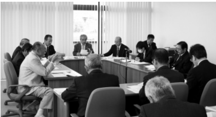
【付託案件】 議案/第54号・58号

付託された議案2件について、慎重審議した結果、すべて可決すべきものと決定しました。また現場視察を6箇所おこないました。委員会での主な意見や質疑は、次のとおりです。 意見 宝見団地建設の用地を買収する場合は、地権者と合意のもと、建設してもらいたい。