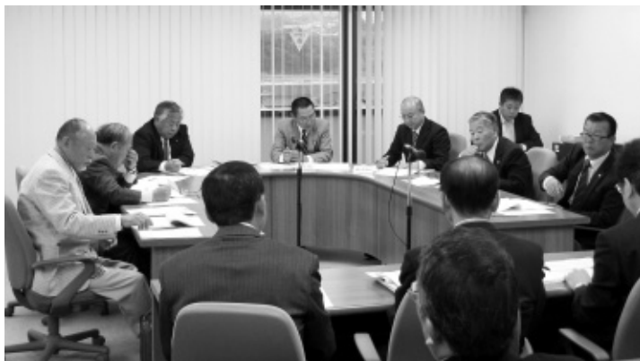
【付託案件】 議案/第54号 請願/第6号

付託された議案1件、請願1件について、慎重審議した結果、すべて可決・採択すべきものと決定しました。委員会での主な意見や質疑は、次のとおりです。 問 防火水槽補修工事の場所は。町内8箇所を予定している。