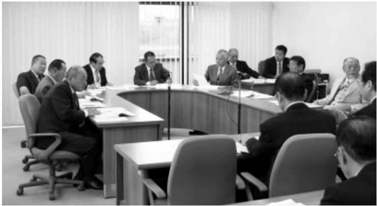
【付託案件】 議案/第52号・53号・54号・55号・56号・57号 請願/第7号

付託された議案6件、請願1件について、慎重審議した結果、すべて可決・採択すべきものと決定しました。委員会での主な意見や質疑は、次のとおりです。 問 オストメイト対応トイレ(人工肛門や人工膀胱の方に対応できるトイレ)補修工事が計上されているが、町内の施設には何箇所あるのか。