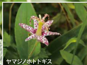
ヤマジノホトギス