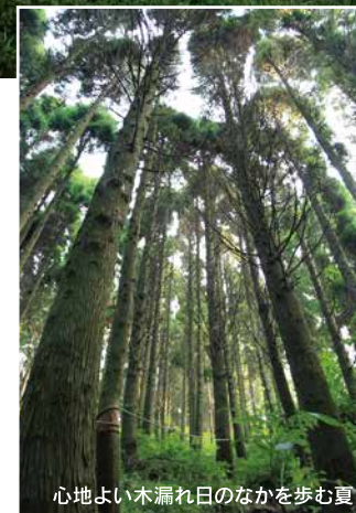
心地よい木漏れ日のなかを歩む夏

福智山は、四方どの登山道から登っても必ず滝や溪流と出会う、水源豊かな山です。轟々とした滝の音や小川のせせらぎ、岩を伝う静かな水音。夏は、そんな涼やかな水の流れを感じながら登山を楽しむことができます。足元に気をつけて歩くとかわいい野花や珍しい植物を見つけられます。深緑の木陰の中、マイナスイオンを浴びながら、ゆったりと涼やかに登山を楽しむ。そんな夏の福智山へ、ぜひいらしてください。