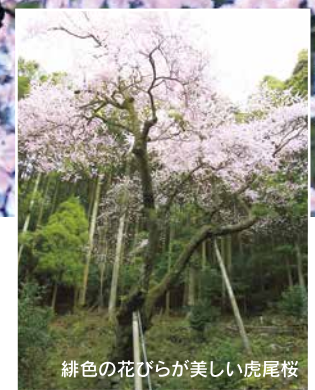
緋色の花びらが美しい虎尾桜