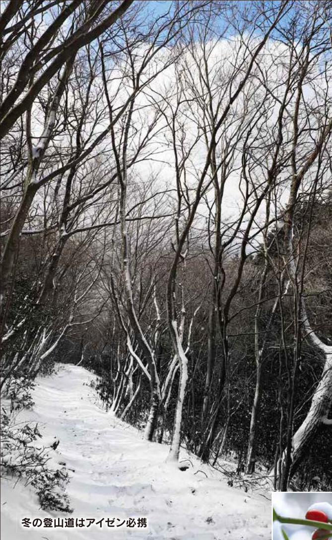
冬の登山道はアイゼン必携