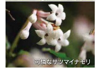
可憐なサツマイナモリ