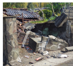
熊本地震で倒れた門柱と塀