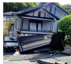
熊本地震で倒壊した家屋

「阪神淡路大震災」や「熊本地震」の揺れで亡くなった人の8割が住宅の倒壊などによる圧死でした。「福智山断層帯地震」での町内被害想定では、建物倒壊による死者が10人、重傷者20人、建物の全壊は200棟、半壊は800棟におよびます。まずは建物倒壊を防げば、人的被害を大幅に減らすことができます。