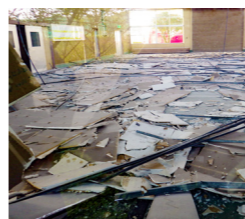
熊本地震で落下した天井