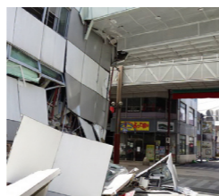
熊本地震で押し潰された建物