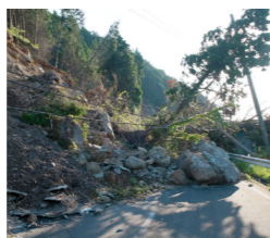
熊本地震で寸断された道路