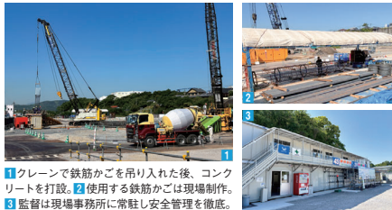
1 クレーンで鉄筋かごを吊り入れた後、コンクリートを打設。2 使用する鉄筋かごは現場制作。3 監督は現場事務所に常駐し安全管理を徹底。

3月に着工した総合体育館建設工事は計画どおり進行しています。現在は、地盤を掘削して穴をあけ、鉄筋かごとコンクリートを流し込む場所打ち杭工事を進めています。5月末時点で103箇所のうち約8割の打設が完了。杭工事完了後は基礎工事に移行します。安全を最優先として今後も適切に施工を進めてまいります。