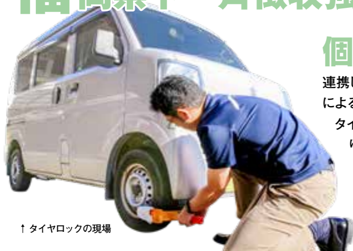
↑ タイヤロックの現場

個 人住民税をはじめとする地方税の徴収率向上と滞納の縮減を図るため、福岡県および県内自治体が連携して11・12月を「県下一斉徴収強化月間」とし、広報による納税推進、滞納者に対する催告の強化、差押えやタイヤロック、捜索による滞納処分強化等を行い、より一層徴収対策に取り組めます。皆様から納めていただく税金は、私たちの暮らしを支える貴重な財源。税金が無ければ、「ごみ収集ができない」「道路が整備されない」「公共施設の利用料金が値上がりする」等、十分な行政サービスが行えなくなります。