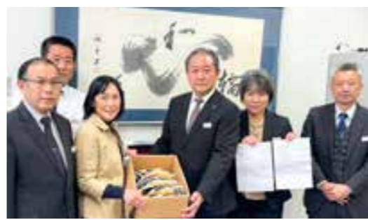
←大小2つの右利き用グローブと左利き用グローブの合計3つを各学校へ配布