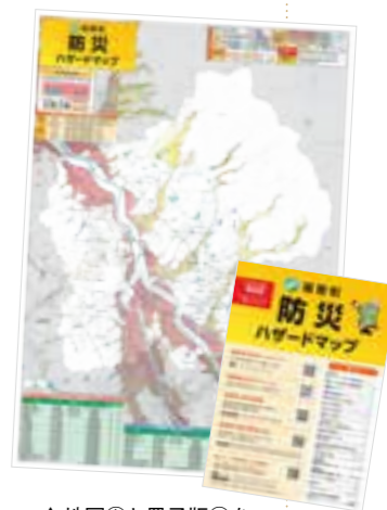
↑ 地図④と冊子版⑤を全世帯に配布します

防災情報や地図上の危険な場所(浸水や洪水、土砂災害区域)、避難所等の情報を掲載する「福智町防災ハザードマップ」を一新。今回は、地図(A1サイズ)に加えて冊子版(B4サイズ)を作成し、より詳しく防災対策や備え、情報の収集先などを掲載しています。2月から全世帯への配布と、本庁3階防災管理・管財課窓口での配布を実施。災害時への備えとしてご活用ください。