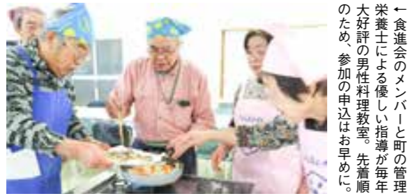
←食進会のメンバーと町の管理栄養士による優しい指導が毎年大好評の男性料理教室。先着順のため、参加の申込はお早めに。

食 材の切り方や計り方など、料理の基礎を学びながら、簡単なお料理を作ってみませんか。