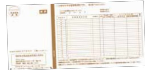
←皆さんのお手元に届く圧着ハガキ(表)の見本。

県 後期高齢者医療広域連合では、加入者に健康や医療への認識を深めてもらうため、7・11・2月に医療費通知を発行しています。今年4月から7月診療分の医療費通知は、11月末に発送予定。通知は、送付先を変更している場合を除いて、被保険者本人住所に圧着ハガキでお届けします。