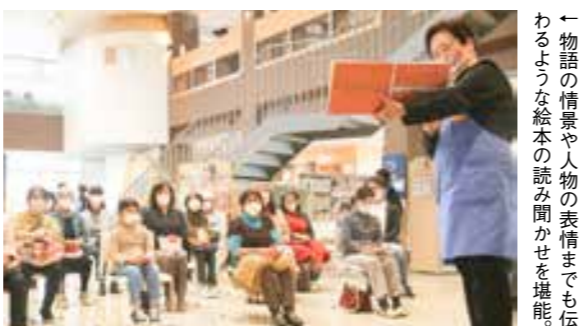
←物語の情景や人物の表情までも伝わるような絵本の読み聞かせを堪能。

絵 本を読む会の「絵本のつどい」が、今年も開催決定。奥深い絵本の世界をのぞいてみませんか。