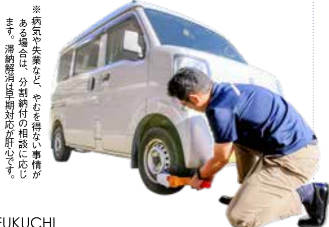
※病気や失業など、やむを得ない事情がある場合は、分割納付の相談に応じます。滞納解消は早期対応が肝心です。

福 岡県と県内市町村は、11月と12月を県下一斉徴収強化月間に定め、財産の差押えを強化し、税金の徴収強化を図ります。税金は、皆さまの暮らしを支える公共サービスの財源。足りないと、ごみ収集箇所が減ったり、道路の穴を補修できなくなったり、公共料金が値上がりするかもしれません。期限内納付へのご理解とご協力をお願いします。