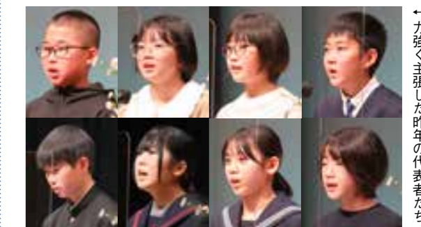
←力強く主張した昨年の代表者たち。

町 内7校の代表者8人が、将来の目標や日頃の思いなどを文章に込めて、5分間の発表を行います。堂々の主張を、ぜひ会場でご覧ください。