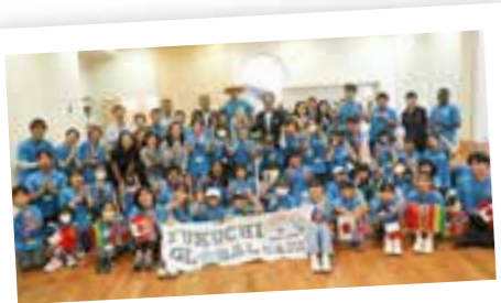
各自好きなポーズで記念撮影

異文化を町内で体験 参加児童の成長体験 町内で異文化に触れられると昨年好評を博した「ふくちグローバルキャンプ」が、8月23日にコスモス保健センターで開かれました。世界各国の異文化を体験・学習できるこのイベントに、町内の小学4〜6年生の30人が参加。タイ総領事館やタイ国政府観光庁、立命館アジア太平洋大学の留学生、ボランティア団体・F1WC九州の学生による特別なワークショップが行われました。最初は緊張していた子どもたち。終盤には、笑顔で留学生と話したり、自分の意見を発表するなど、大きく成長した姿をみせていました。