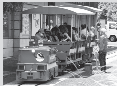
←トンネル内ではコウモリが飛び交う様子も見られる赤村観光トロッコ

3.6キロの道のりを25分で往復するトロッコ列車の運行のほか、赤村特産物センターのお買物券が当たる抽選会や駄菓子のかみ取り大会、和太鼓の演奏などが行われます。ご来場をお待ちしております。