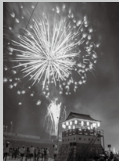
「新型コロナウイルスの影響で4年ぶりに開催される」夏まつり盆踊り大会。約1600発の打上花火が香春町の夜空を彩ります。