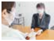
母子健康手帳交付