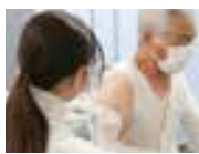
新型コロナワクチン接種