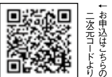
「お申込は以下の二次元コードより」

世 界各国から福智町にやってくるお友達のホストファミリーを募集します。身近な国際交流ができるチャンスです。