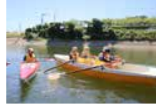
←イケメン指導員が優しく時に厳しく指導します！

夏 休みの思い出作りに、貴重なカヌー体験にチャレンジしてみませんか。先着20人限定ですので、お早めにお申し込みください。