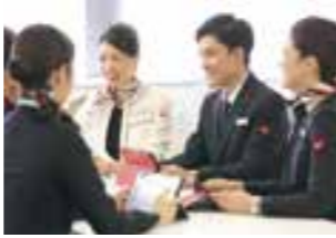
←航空会社JALならではの本物体験講座をご用意。

航 空業界で働くことに興味をお持ちの皆さま、JALの現役社員が、航空業界の魅力や、通常の業界研究では知り得ないリアルな情報、今求める人材像を直接お伝えし、あなたの夢の実現をしっかりとサポートします。