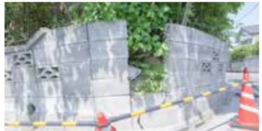
←高さ1m以上で倒壊の危険があるブロック塀などを対象に補助

地 震時の2次被害などを未然に防止するため、倒壊の危険がある町内のブロック塀などを撤去する費用の一部を補助します。申請には条件がありますので、詳細は問合せ下さい。