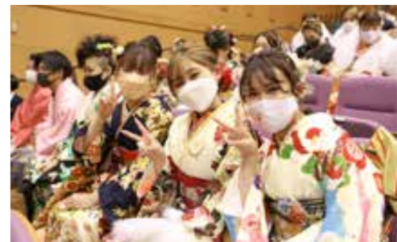
←11月頃に対象者へ式典のご案内を送付。

今 年4月に民法改正で「成年年齢」が20歳から18歳に引き下げられましたが、福智町では従来どおり、その年度に20歳になる人を対象に式典を実施。また、式典の名称を「成人式」から「二十歳のつどい」に変更しました。来年の予定は次のとおりです。 日程 令和5年1月8日(日) 会場 福智町地域交流センター