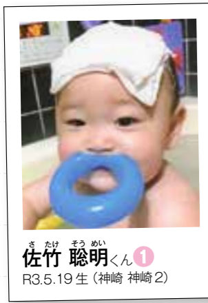
さたけ そうめい 佐竹 聡明くん① R3.5.19生(神崎 神崎2)